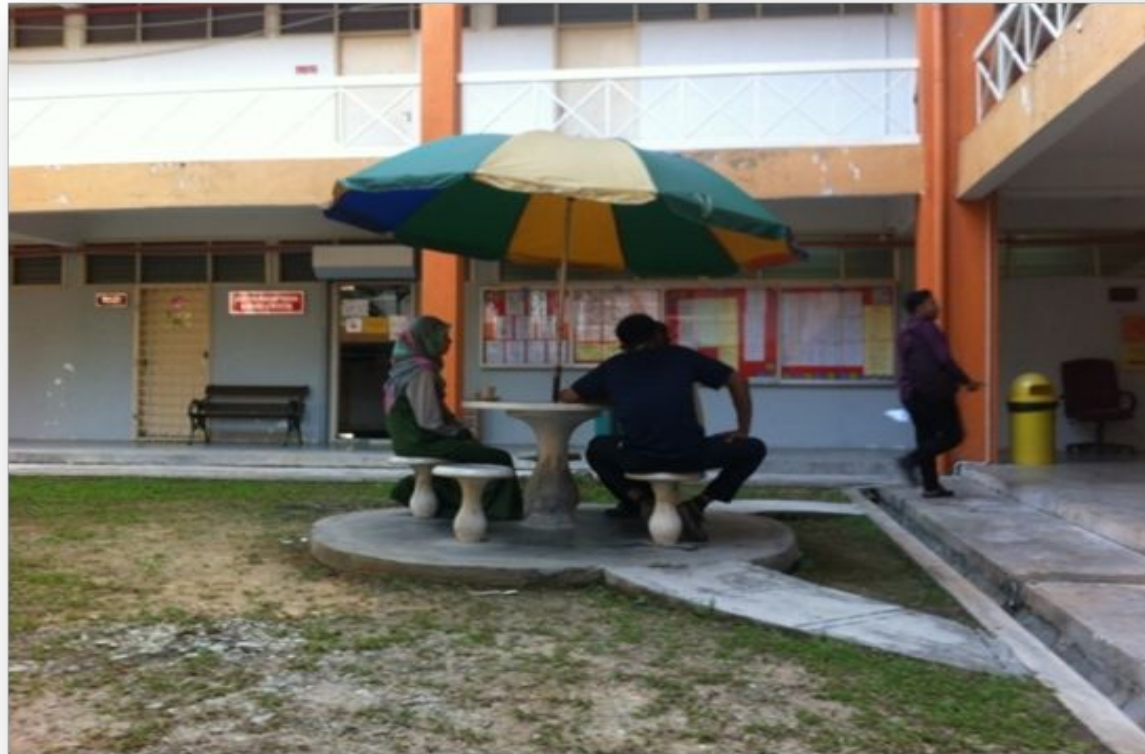
PENJURU KIRI BLOK A