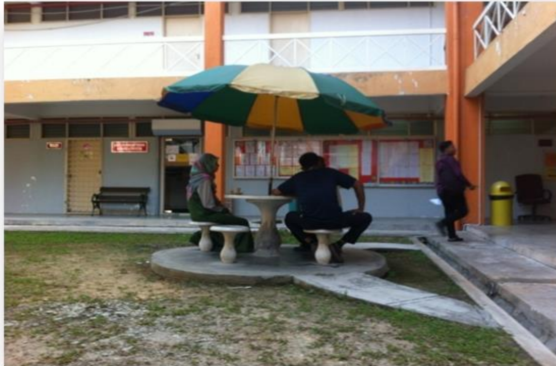
PENJURU KIRI BLOK A